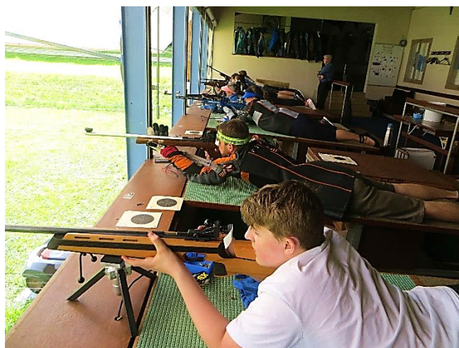
Schönes bild «Jung und Alt miteinander